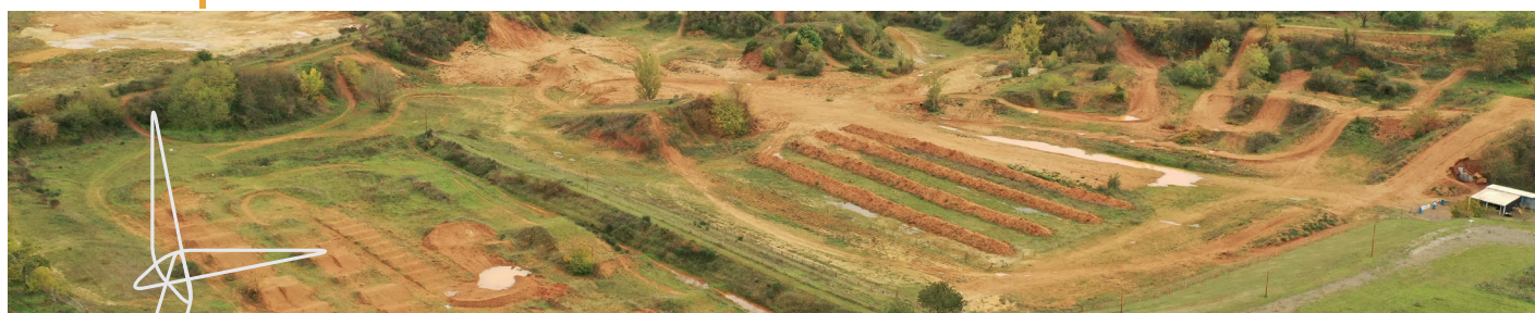
Photo aérienne de la zone de projet.

Du 1 er juin au 3 juillet , chacun est invité à consulter le dossier de permis de construire et à participer à l'enquête publique. Ce dossier sera mis à disposition du public en mairie de Saint-Georges-lès-Baillargeaux, Préfecture de la Vienne ou sur internet, sur le site : https://www.vienne.gouv.fr