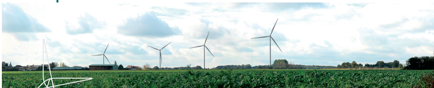
Photomontage du Parc éolien de Louin réalisé en sortie du hameau de la Guichardière sur la D27.

Dans le cadre de l'instruction du projet, la Préfecture se chargera d'organiser une enquête publique . Les habitants et les élus des communes du projet, ainsi que des communes situées dans un rayon de 6 km autour du projet, seront conviés pour donner leur avis. Cela vous concerne toutes et tous, riverains et élus.