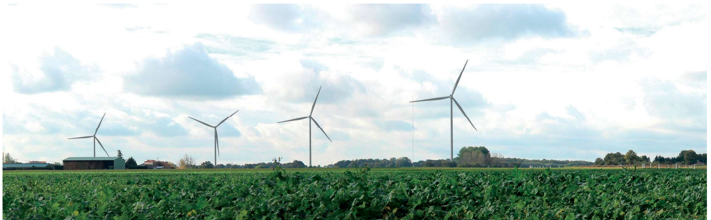
Photomontage du Parc éolien de Louin réalisé en sortie du hameau de la Guichardière sur la D27.