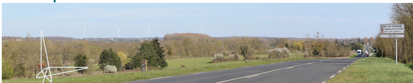
Photomontage réalisé depuis la D943 entre Fléré-la-Rivière et Châtillon-sur-Indre

En octobre 2021 , la société eXplain, spécialisée en concertation locale, est allée à la rencontre des riverains du projet sur les communes du Tranger, de Saint-Médard et de Châtillon-sur-Indre . 79 conversations ont été engagées avec les habitants. L'analyse des échanges a montré que 87 % des répondants étaient bien informés du projet . Globalement, l'opinion était positive, l'éolien étant perçu comme une solution pour la transition énergétique . Les principales questions ont porté sur le choix de la zone d'étude, les revenus fiscaux pour le territoire, les besoins pour la transition énergétique et la production de l'éolien dans ce cadre. Nous y répondons dans cette lettre d'information.